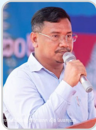
លោក ឈីន ឈីន លោក ឈីន ឈីន